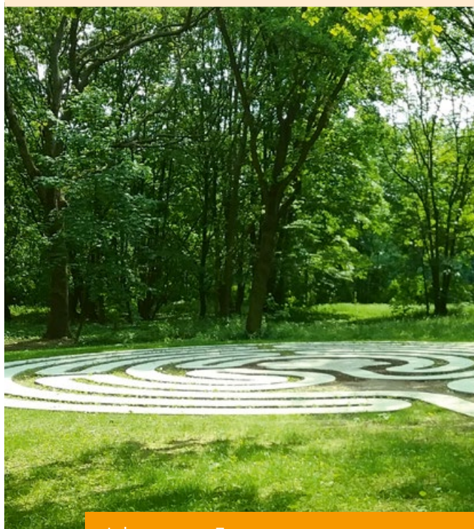
Lebenswege – Trauerwege